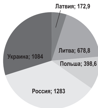
Рисунок. Протяженность белорусской границы с сопредельными странами

1. Достаточно высокая протяженность внешних границ. Она составляет 3617,3 км. При этом наибольшую протяженность имеет граница с Россией (1283 км), наименьшую – с Латвией (172,9 км) (см. рисунок).